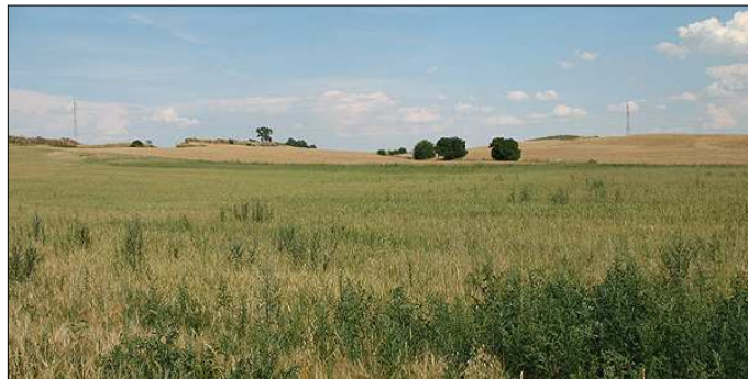
północno-wschodnia panorama wsi

Większość powierzchni gminy położona jest w obrębie mezoregionu Wzgórz Dalkowskich, a ściślej – jego mniejszej jednostki (mikroregionu), Grzbietu Dalkowskiego. Obszar gminy charakteryzuje się dużymi różnicami wysokości względnych terenu na niewielkich odległościach, co nadaje mu wysokie walory krajobrazowe – tj. zróżnicowaną rzeźbę terenu z lokalnymi kulminacjami, wąwozami i jarami.