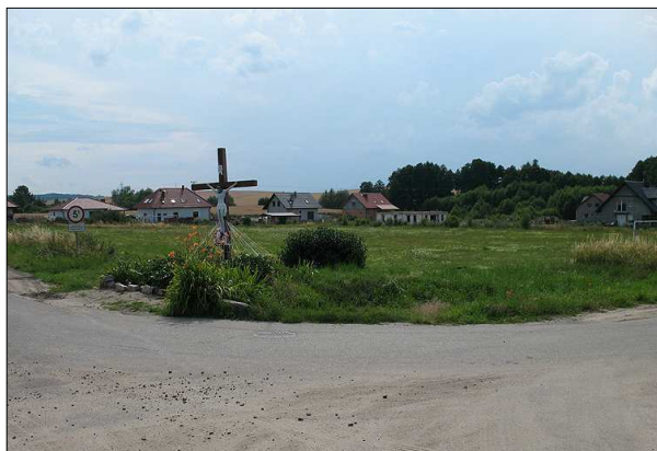
widok na teren wymagającego modernizacji boiska ~~ planowane centrum społeczno-kulturalne wsi

W sołectwie Modła brak jest zakładu opieki zdrowotnej. Mieszkańcy w zakresie podstawowej opieki medycznej, w większości korzystają z usług lekarza rodzinnego w oddalonej o ok. 6 km Jerzmanowej. Również w tej miejscowości mieszkańcy mają dostęp do stomatologa i apteki.